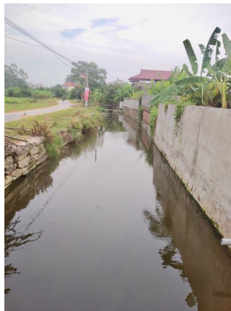
(Cuối tuyến kênh)