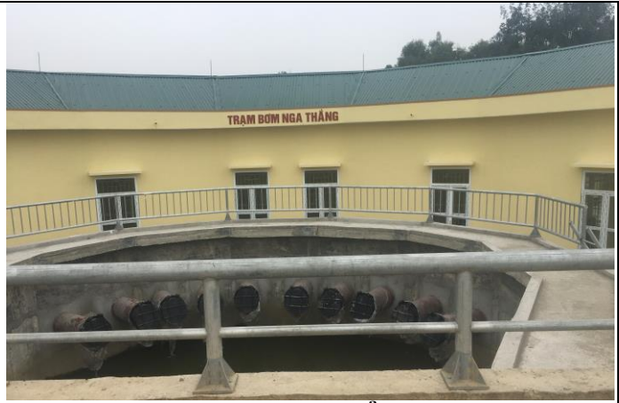
Chính diện bể xả

+ Thiết bị: Tủ điện tổng, tủ bán tự động và tận dụng cũ, dây cáp thay mới.