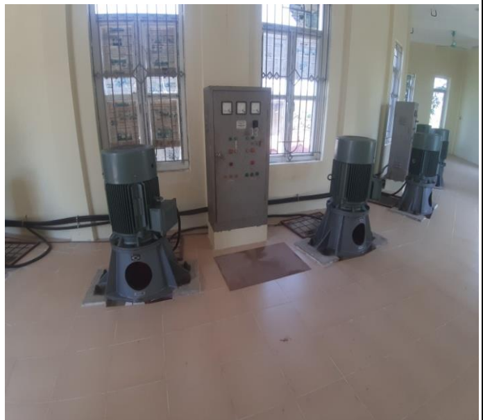
Thiết bị trong nhà trạm