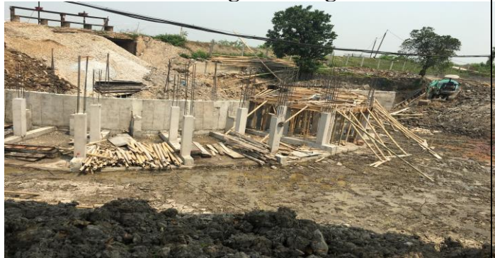
Thi công sàn tầng đặt máy bơm