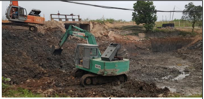
Thi công hố móng

Một số hình ảnh trong quá trình thi công trạm bơm năm 2019