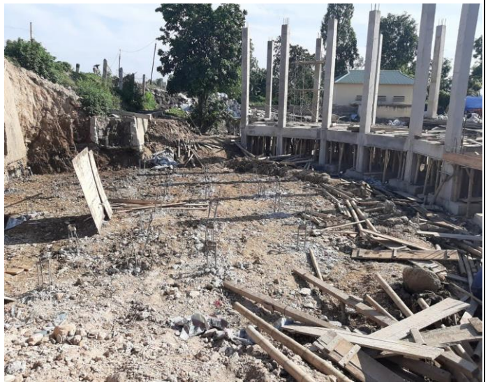
Thi công ép cọc bê tông trạm bơm