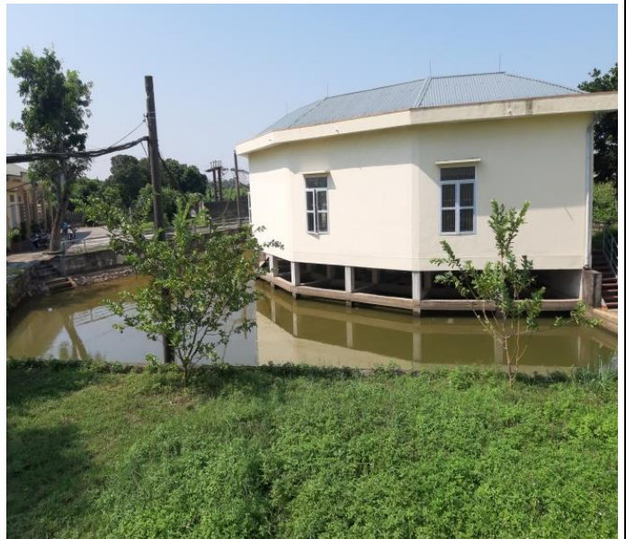
Bể hút trạm bơm